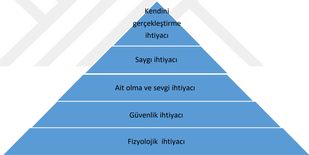
Şekil 2.1. Maslow'un İhtiyaçlar Hiyerarşisi Piramidi

5. Kendini Gerçekleştirme İhtiyacı: Maslow’a göre tüm bu ihtiyaçlar karşılandığında yeni bir hoşnutsuzluk ve rahatsızlık başlar ve bireyler kendilerini gerçekleştirme çabasına girerler. Maslow, çok az sayıda insanın potansiyellerini tam olarak gerçekleştirebildikleri bir konum olan kendini gerçekleştirme noktasına ulaştığını öne sürmektedir (Burger, 2006:430-435). Maslow, bu ihtiyaçları şekil 2.1. de görüldüğü gibi sıraya koymuştur.